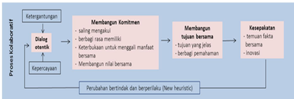
Gambar 1. Proses Kolaboratif

seluruh pemangku kepentingan, bahkan disepakati. Setelah tujuan proses kolaboratif terbangun, diharapkan diperoleh hasil sementara berupa temuan fakta gabungan dan temuan yang disepakati bersama sebelum akhirnya sampai pada konsensus. Hal terakhir yang dapat diperoleh dalam proses kolaboratif ini adalah adanya perubahan cara berperilaku dan bertindak bagi para peserta proses kolaboratif, yaitu adanya adanya saling menghargai, saling mendengarkan diantara para peserta proses kolaboratif ( new heuristic ).