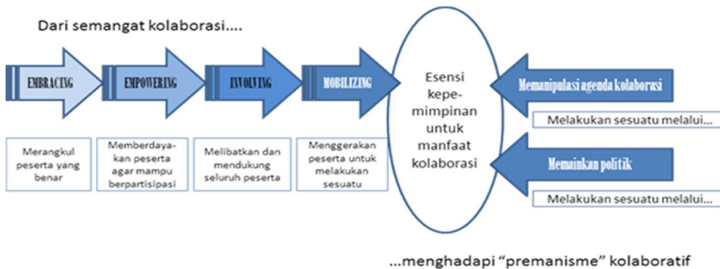
Gambar 2. Esensi Kepemimpinan Untuk Manfaat Kolaboratif