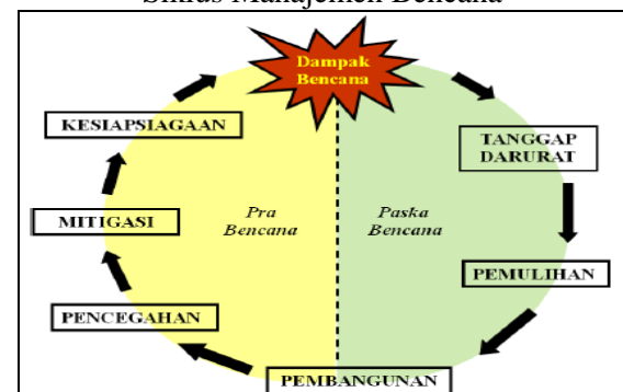
Gambar 2 Siklus Manajemen Bencana

menumpuk bahan pangan (Charlotte Benson dkk, 2007 dalam MPBI, 2009). Dalam siklus manajemen bencana, upaya kesiapsiagaan termasuk dalam fase pengurangan resiko sebelum terjadinya bencana. Pergeseran konsep penanganan bencana menjadi paradigma pengurangan resiko bencana semakin menekankan bahwa upaya kesiapsiagaan bencana merupakan salah satu tahapan penting untuk mengurangi besarnya kerugian yang timbul akibat adanya bencana.