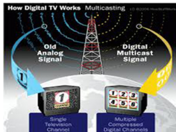
Gambar 1 Sistem multipleksing pada penyiaran digital

Selain memberikan saluran frekuensi yang lebih banyak, penggunaan teknologi multipleksing tentunya akan memberikan efektivitas dan efisiensi penggunaan kanal frekuensi. Dari efisiensi penggunaan kanal frekuensi tersebut ada kelebihan frekuensi yang dikenal dengan frequency gap atau digital deviden . Selama ini dengan menggunakan sistem penyiaran analog, dibutuhkan frekuensi sebesar 320 MHz. Dengan penyiaran digital, frekuensi yang dibutuhkan cukup sebesar 168 MHz. Akan ada kelebihan frekuensi sebanyak 112 MHz yang bisa digunakan secara maksimal untuk meningkatkan pelayanan pemerintah kepada rakyat dalam bidang komunikasi, misalnya mengatasi kesenjangan digital yang terjadi antara wilayah perkotaan dan wilayah sub-urban. Dengan kesenjangan digital yang terjadi antara wilayah perkotaan dan wilayah pinggiran maka semakin menambah jarak ( gap ) kemajuan pembangunan antara wilayah kota dan wilayah pinggiran karena internet atau dunia digital merupakan pintu utama dalam rangka mempercepat laju pembangunan suatu daerah dan peningkatan kesejahteraan masyarakat yaitu