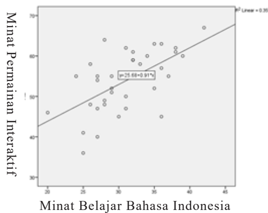
Gambar 3 Bagan pencar relasi minat permainan interaktif dengan minat permainan kosakata