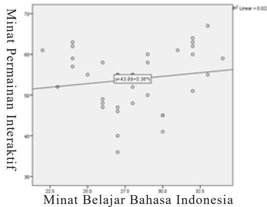
Gambar 2 Bagan pencar relasi minat belajar bahasa Indonesia dengan minat permainan interaktif

Dari gambar 2, dapat terlihat arah garis dalam diagram yang menaik dari kiri ke kanan, hal ini menunjukkan semakin tinggi minat bermain permainan interaktif pada responden, semakin tinggi minat belajar bahasa Indonesia. Dari hasil