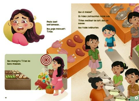
Gambar 6 Halaman 10-11

Pada halaman 8, hubungan teks dan ilustrasi adalah enhancement , dimana ilustrasi meningkatkan makna dengan menunjukkan bahwa Titan sudah berjalan dengan bersemangat menuju kios hewan peliharaan. Sedangkan pada halaman 9, terdapat hubungan kontradiksi antara ilustrasi dengan teks kalimat terakhir, dimana ekspresi wajah Titan masih larut dalam kesenangan dan belum teringat ibu.