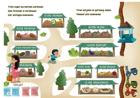
Gambar 7 Halaman 12-13

Kedua halaman menunjukkan hubungan simetri antara gambar dan ilustrasi yang saling merepresentasikan makna yang sama.