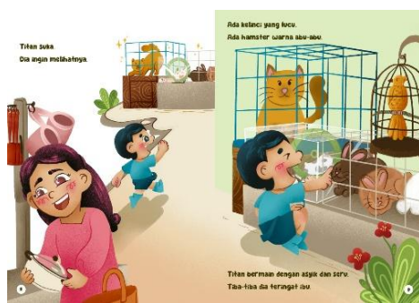
Gambar 5 Halaman 8-9

Halaman 6 menggunakan hubungan gambar-teks simetri, antara teks dan gambar memiliki makna yang sama, sesuai teks, Titan sedang melihat-lihat kudapan. Pada halaman 7, menggunakan hubungan komplementer dengan ilustrasi melengkapi teks dengan tidak hanya menunjukkan berbagai kios, namun juga interaksi tokoh yang terjadi di depan kios tersebut.