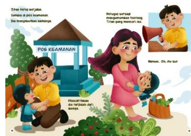
Gambar 10 Halaman 18-19

Pada halaman 16, hubungan gambar-teks adalah kontrapoin dimana teks dan gambar memiliki makna yang berbeda walaupun saling terkait dalam hal konteks karena di pasar banyak orang-orang baru seperti yang dinasihatkan ibu. Halaman 17 menunjukkan hubungan simetri, teks dan gambar menunjukkan keterikatan makna.