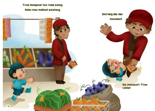
Gambar 8 Halaman 14-15

Halaman 13 menunjukkan hubungan simetri antara teks dan gambar yang menunjukkan makna yang serupa.