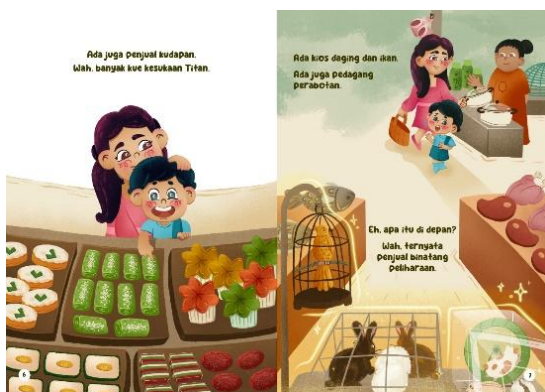
Gambar 4 Halaman 6-7

Halaman 4-5 menggunakan hubungan gambar-teks simetri, teks dan ilustrasi menunjukkan makna yang sama dalam menggambarkan Titan dan Ibu di pasar berjalan menyusuri kios-kios yang menjual berbagai sayur dan buah segar.