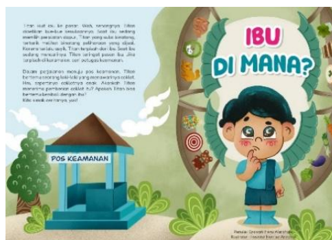
Gambar 2 Cover Depan + Belakang (sumber: Buku Ilustrasi: Ibu di Mana?)

Berikut adalah hasil analisis dan elaborasi dari hubungan gambar-teks dalam buku ilustrasi anak “Ibu di Mana?” yang meliputi kajian makna berbagai tanda serta hubungan antara teks dan ilustrasi pada setiap halaman buku.