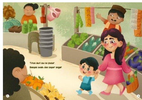
Gambar 3 Halaman 4-5

Pada cover , kata dan ilustrasi memiliki hubungan perluasan makna ( enhancement ), di mana gambar memberikan perluasan makna judul “IBU DI MANA?” dengan memberikan konteks lokasi pasar yang identik dengan berbagai kios. Hubungan gambar-teks pada teks keterangan penulis dan ilustrator dengan ilustrasi adalah kontrapoin karena menjelaskan hal yang berbeda. Sedangkan pada cover , terdapat hubungan komplementer ( complementary ) karena memberikan informasi yang berbeda, namun saling melengkapi terkait usaha Titan mencari Ibu dan keberadaan Pos Keamanan yang akan membantu usaha Titan.