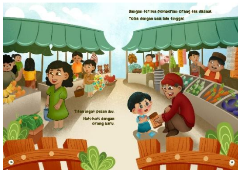
Gambar 9 Halaman 16-17

menunjukkan hubungan simetri antara teks dan gambar.