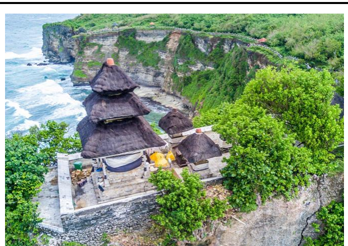
Gambar 1. Pura Luhur Uluwatu

Pura Luhur Uluwatu merupakan salah satu dari enam pura Sad Kahyangan Jagat yang memiliki tingkat kesucian tinggi bagi umat Hindu Bali. Terletak di puncak tebing yang menghadap langsung ke Samudera Hindia, pura ini memiliki daya tarik visual dan simbolik yang sangat kuat. Keindahan alam berpadu dengan arsitektur pura menjadikannya salah satu ikon pariwisata budaya Bali. Dalam konteks glokalisasi, Pura Luhur Uluwatu memperlihatkan bagaimana nilai lokal beradaptasi terhadap eksposur global melalui pariwisata.